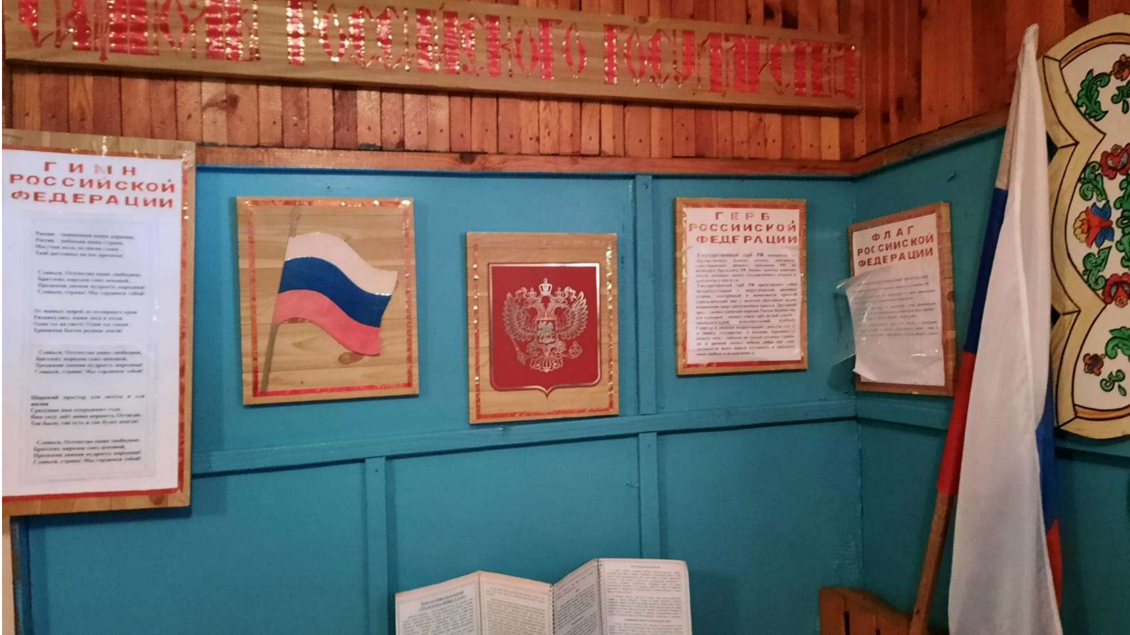
уголок патриотического воспитания