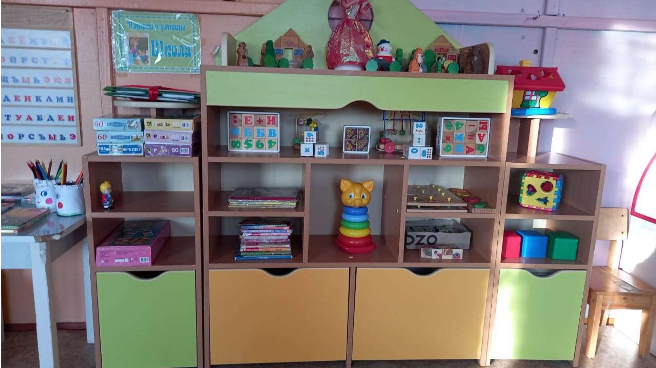
уголок юного конструктора